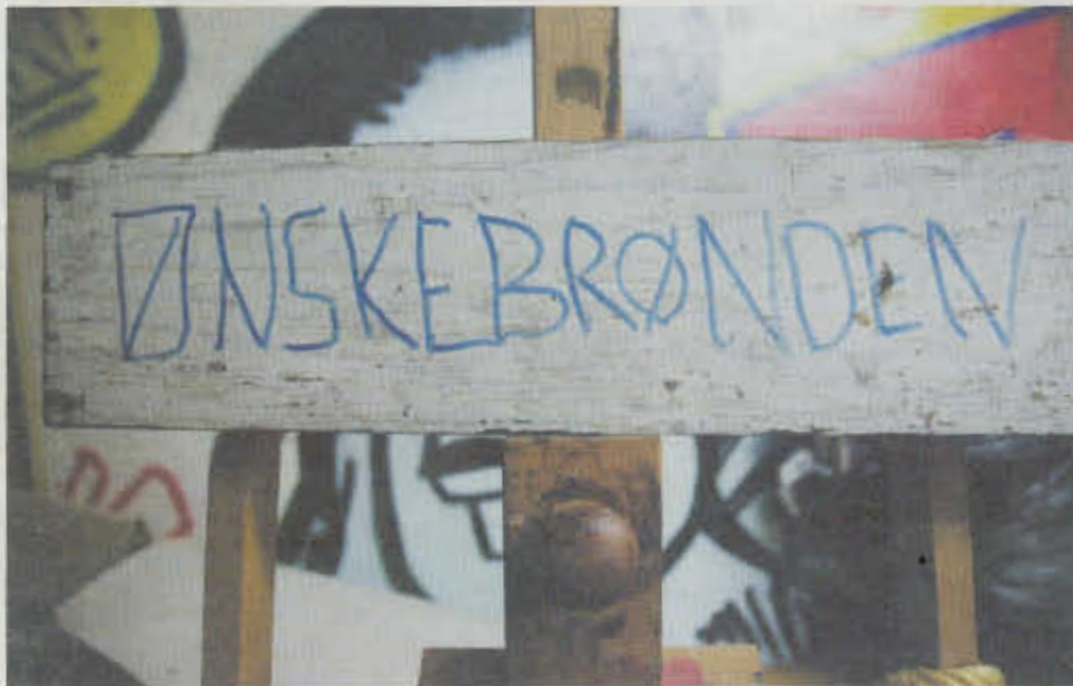
Indtil den gik i stykker, samlede de unge penge ind i gaderne i en barnevogn med vand i og skiltet 'Ønskebrønden'.

I kommunens tilsynsrapport fra 2007 står der bl. a. »at hashmisbruget i Gaderummet skal ophøre, og medarbejderne skal gribe ind, hvis de ser, at de unge ryger«, og »at Gaderummet ikke må anbefale de unge at holde op med at tage medicin, uden det er drøftet med en psykiater.« Derudover må der ikke