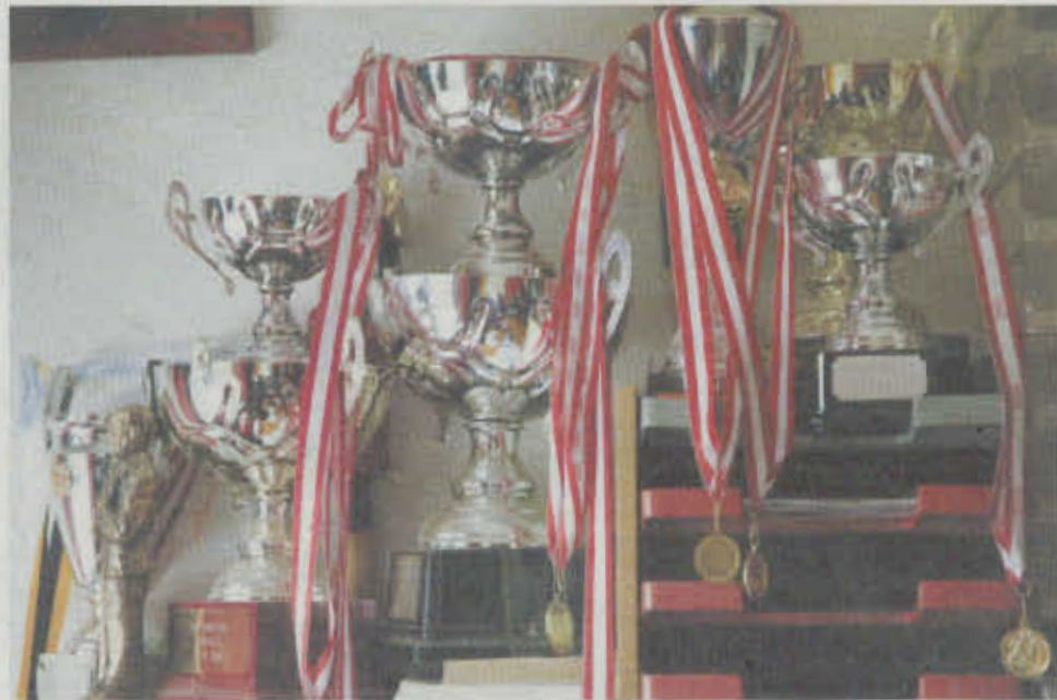
Gaderummet deltog sidste gang i VM i Hjemløsefodbold i juli og august 2007.