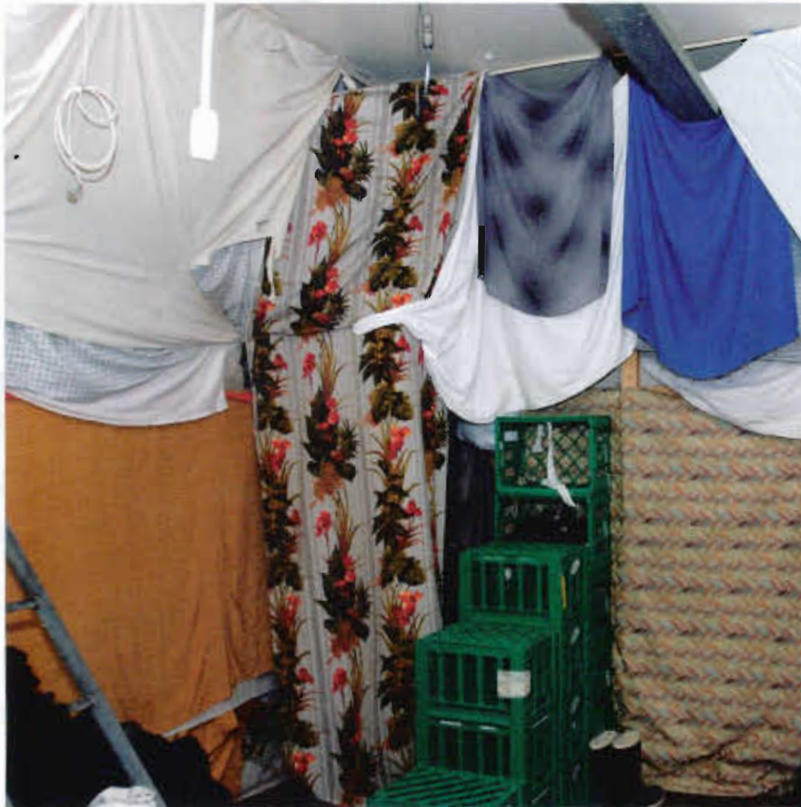
De unge hjemløse sover i hjemmelavede køjesenge og på madrasser på gulvet i Gaderummet på Nørrebro

På Gaderummets hjemmeside ligger et brev skrevet af en ung fyr, da han var 17 år. Han har levet selvstændigt siden 14-års-alderen og har netop fået en lejlighed, men nåede inden da at leve som hjemløs i Københavns gader i halvandet år: